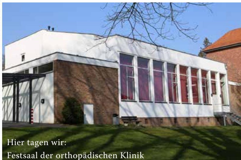
Hier tagen wir: Festsaal der orthopädischen Klinik

Ort der Abendveranstaltungen: Vereinsheim TV 1848 Bökelstr. 63 41063 Mönchengladbach